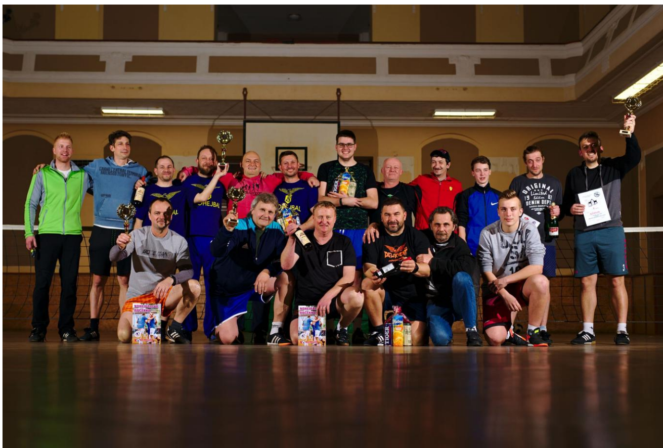
Společné foto nejlepších družstev.