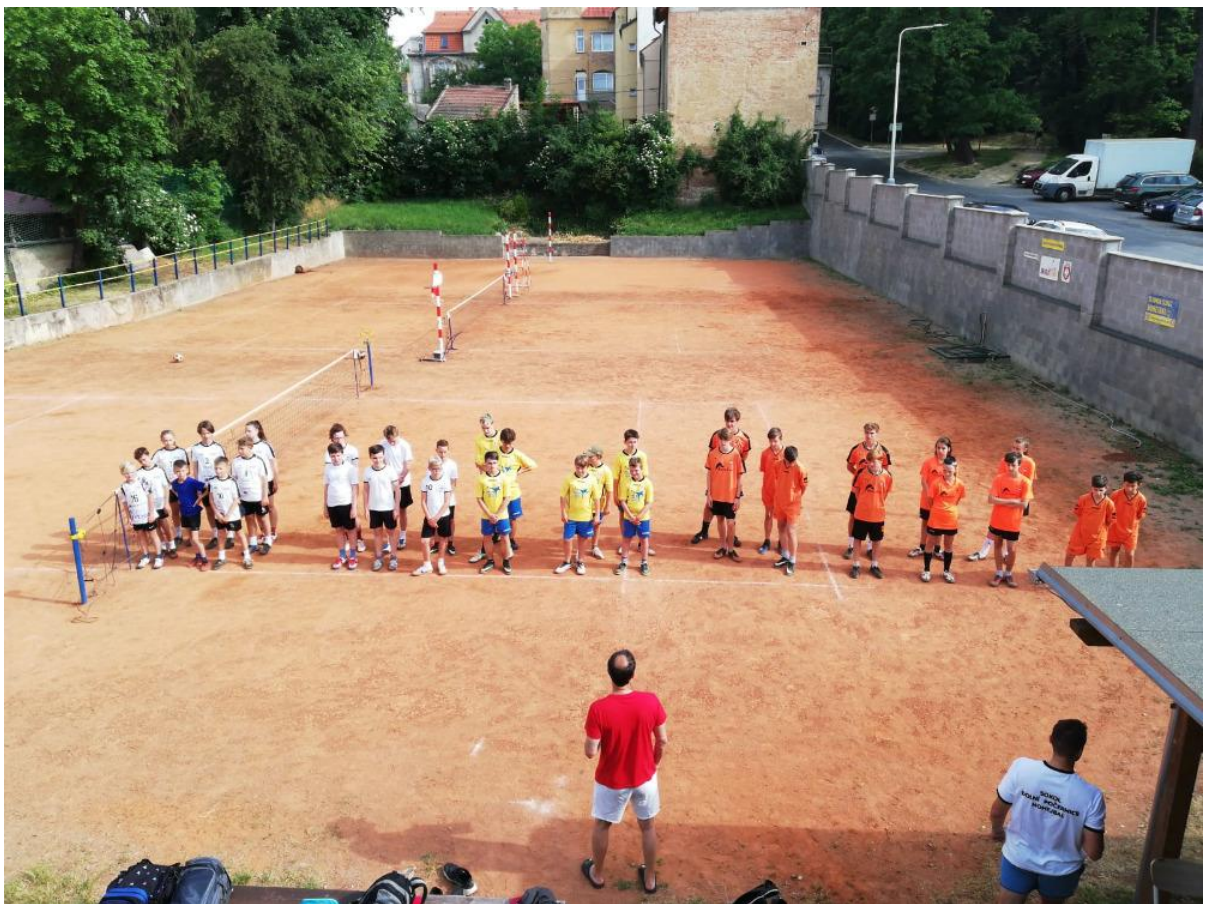
Nástup družstev do turnaje dvojic mládeže, dne 20. června 2021 ve Slaném.