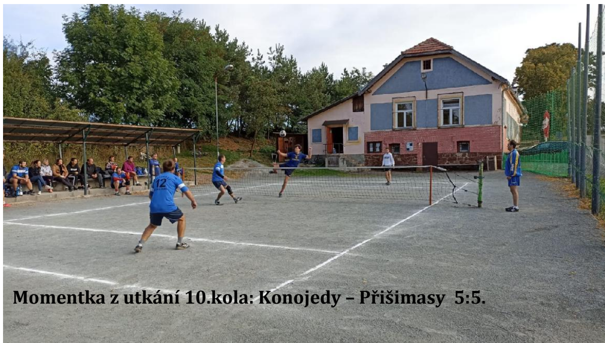
Momentka z utkání 10.kola: Konojedy – Přišimasy 5:5.