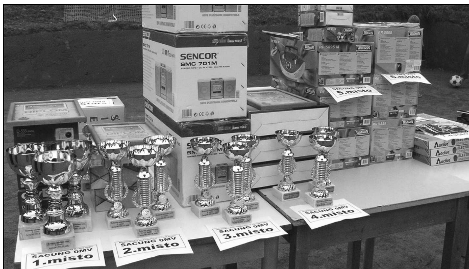
Praktické je označení jednotlivých cen cedulkou s pořadím

Pořadatel by proto měl mít připraveno vše potřebné pro vyhlášení již během posledního zápasu. Tj. konečné pořadí, včetně jmen hráčů, individuální ocenění (jsou-li vyhlášována), ceny a osoby, které je budou předávat. Je-li cen větší množství, vyplatí se mít k ruce i jejich seznam s přiřazením k příslušnému umístění. Případným nepříjemnostem při předávání a vyhledávání cen lze předejít i jejich pečlivým rozmístěním na předávacím stole, vč. cedulek s číslem pořadí.