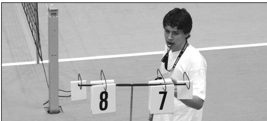
Ukazatel stavu setu a zápasu je při rozhodování nezbytností

Na vrcholných turnajích by nemělo být rozhodování zápasů svěřeno do rukou samotných hráčů, ale kvalifikovaným rozhodčím. Náklady na rozhodčí představují méně významnou položku v rozpočtu turnaje, investice se zcela jistě vyplatí.