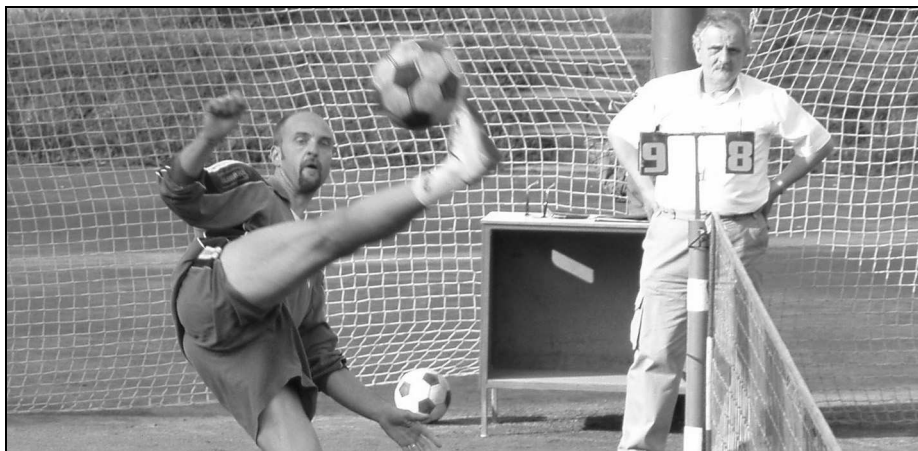
Náhradní míč v blízkosti rozhodčího by měl být samozřejmostí

Výsledkem je minimalizace proluk, jejichž součet někdy dosahuje až 30% hrací doby turnaje!