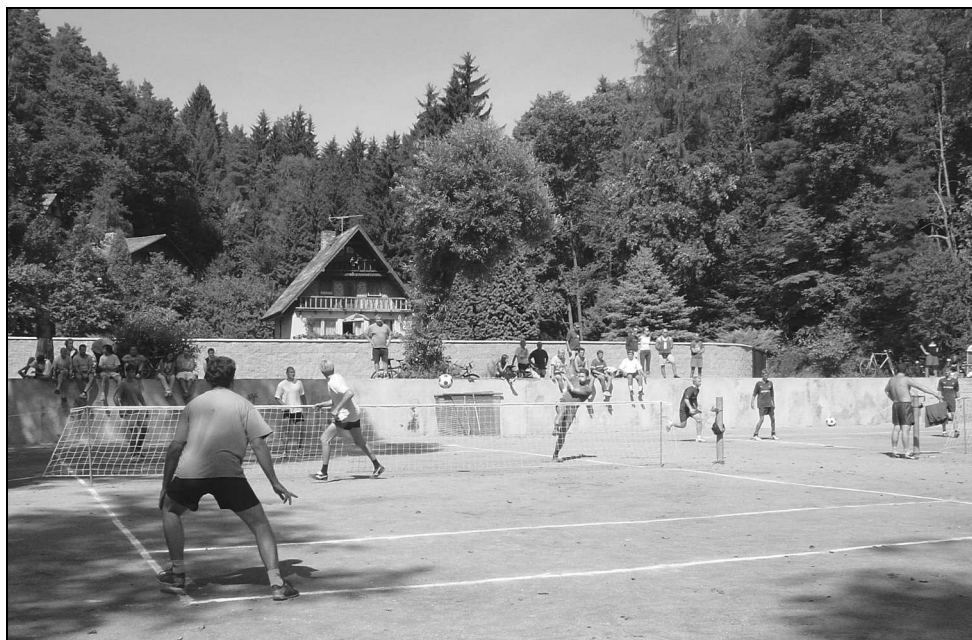
Tradiční pohoda 42. ročníku osadního turnaje Merida v Posázaví

Zabývat se v dalším textu budeme organizací neoficiálních turnajů jednotlivců, dvojic nebo trojic. Turnaje družstev jsou výjimkou, která má určité výrazné odlišnosti v některých bodech. Těchto turnajů se však hraje naprosté minimum. Oficiální turnaje ČNS mají předem dán svůj charakter vydaným rozpisem soutěže a tak jejich organizace zde není popsána, principiální rozdílnost oproti vrcholným neoficiálním akcím je však minimální.