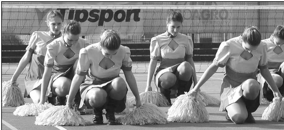
Exhíbiční vystoupení mažoretek

neplatí jen v případech, kdy se podaří pořadateli zajistit aktéry mimořádného jména. Exhíbiční vystoupení jsou zpravidla několikaminutové představení tanečních krací skupin, mažoretek, ale i třeba vystoupení žonglérů s míčem nebo znalců bojových umění. Fantazii se meze nekladou, čím originálnější, tím lépe.