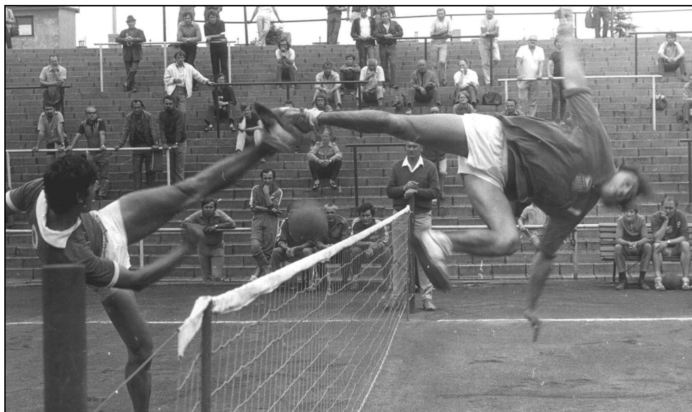
Atraktivní momentka z pražského turnaje Mistrovství ČSR trojic v roce 1973

Elitou mezi turnaji jsou pak mezinárodní akce. Formou jednodenních či vícedenních turnajů probíhají i některé oficiální soutěže Českého nohejbalového svazu (ČNS) a mezinárodní nohejbalové federace FIFTA, včetně světových, evropských a klubových šampionátů.