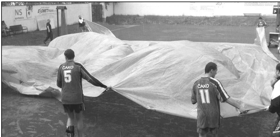
Plachta na zakrytí hrací plochy při dešti je v nohejbale stále zatím luxusem